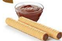
ROLINETTES CHOCHOISSETTES 45 étuis de 2 - 375 g DDM* : 5 mois