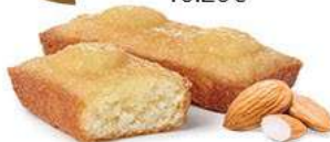
FINANCIERS AMANDES 30 emballages individuels - 660 g DDM* : 2 mois