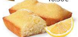
FONDANTS CITRON 30 emballages individuels - 660 g DDM* : 2 mois