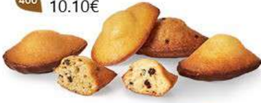
FARANDOLE DE MADEINES 30 emballages individuels - 575 g 5 Madelines ChochoNoir - 5 Madelines Pépites - 5 Madelines Citron - 5 Madelines ChochoPistache - 5 Madelines Pican & Sirop d'Érable - 5 Madelines Caramel Chocolait DDM* : 2 mois