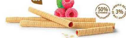
BRINS FRAMBOISE 7 étuis de 7 - 425 g DDM* : 5 mois