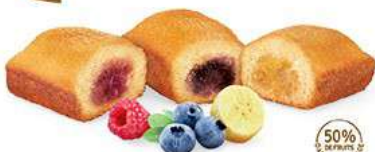
PANACHÉ DE BIJOU FRUITS 30 emballages individuels - 990 g 10 Trambise - 10 Myrtille - 10 Banane DDM* : 2 mois