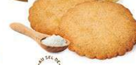
GALETTES 48 étuis de 2 - 880 g DDM* : 5 mois