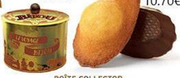
BOÎTE COLLECTOR MADEINES CHOCHO NOIR 12 emballages individuels - 260 g DDM* : 2 mois