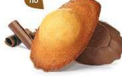
MADEINES CHOCOLAIT 50 emballages individuels - 1080 g DDM* : 2 mois