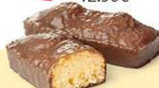
SHOWCOCO 25 emballages individuels - 730 g DDM* : 2 mois