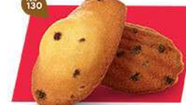
MADEINES PÉPITES 50 emballages individuels - 900 g DDM* : 2 mois