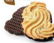
SABLÉS VIENNOIS 32 étuis de 2 - 620 g DDM* : 2 mois