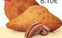
MADEINES PÉCAN & SIROP D'ÉRABLE 20 emballages individuels - 360 g DDM* : 2 mois