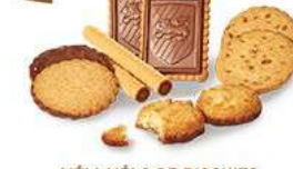
MÉLI-MÉLO DE BISCUITS 46 étuis de 2 - 900 g 8 étuis de 2 Rolinettes ChochoNoisettes - 10 étuis de 2 Craquants Chocolait 10 étuis de 2 ChocoSablés - 10 étuis de 2 Gallettes Caramel d'Isigny 8 étuis de 2 Petits-Beurre Tablette Chocolait DDM* : 5 mois