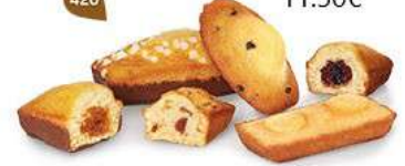
BOUQUET DE PÂTISSERIES 50 emballages individuels - 850 g 5 Madelines Pépites - 5 Gênois Chocolait - 5 Bijou Caramel Chocolait 5 Bijou Myrtille - 5 Financiers Amandes - 5 Cakes Fruits DDM* : 2 mois