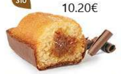
BIJOU CARAMEL CHOCOLAIT 20 emballages individuels - 740 g DDM* : 2 mois