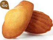
MADEINES NATURE 50 emballages individuels - 880 g DDM* : 2 mois