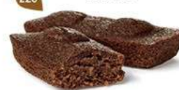
MOELLEUX CHOCOLAIT 30 emballages individuels - 690 g DDM* : 2 mois