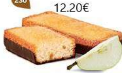
LINGOTS POIRE CHOCHO NOIR 25 emballages individuels - 875 g DDM* : 2 mois