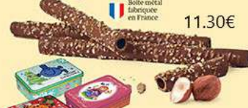
COFFRET BRINS PRALI'CHOC 5 étuis de 4 - 285 g DDM* : 2 mois