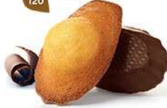
MADEINES CHOCHO NOIR 50 emballages individuels - 1080 g DDM* : 2 mois