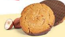
CRAQUANTS NOISETTE CHOCOLAIT 24 étuis de 2 - 360 g DDM* : 5 mois