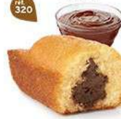
BIJOU CACAO 20 emballages individuels - 660 g DDM* : 2 mois