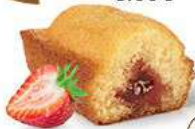
BIJOU FRAISE 20 emballages individuels - 660 g DDM* : 2 mois