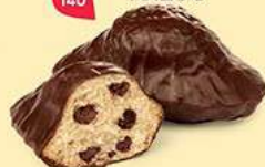
MADEINES ÉCRIN 20 emballages individuels - 490 g DDM* : 2 mois