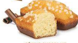
GÉNOIS CHOCOLAIT 30 emballages individuels - 920 g DDM* : 2 mois