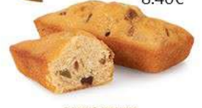
CAKES FRUITS 20 emballages individuels - 600 g DDM* : 2 mois