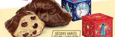
COFFRET MADEINES ÉCRIN 18 emballages individuels - 430 g DDM* : 2 mois