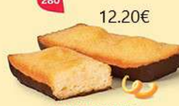
LINGOTS ORANGE CHOCHO NOIR 25 emballages individuels - 645 g DDM* : 2 mois