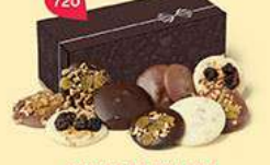
TUILES ET PALETS GOURMANDS 20 chocolats - 200 g DDM* : 10 mois