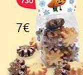
PETITS FLOCONS 10 biscuits - 120 g DDM* : 2 mois